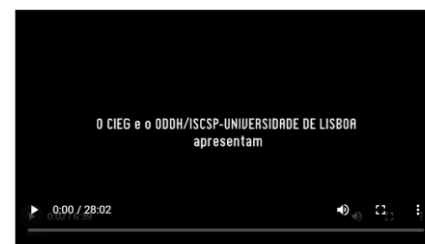
O direito a ter direitos - Documentário