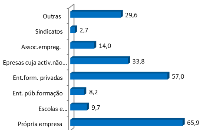
Gráfico 4 – Entidades formadoras

No que se refere às entidades formadoras , 65,9% das empresas indicaram que a formação realizada em 2020 correspondeu a cursos internos de FPC, isto é, cuja conceção e gestão foi efetuada pela própria empresa. A restante formação correspondeu a cursos externos de FPC, isto é, geridos ou organizados por entidades externas à empresa, sendo aí de destacar as entidades formadoras privadas , as quais foram responsáveis pelo maior volume de formação (57 %). Em contrapartida, os sindicatos e as Entidades públicas de formação tiveram uma expressão reduzida 2,7 % e 8,2 %, respetivamente).