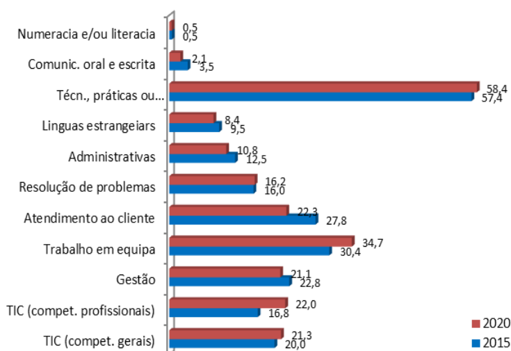
Gráfico 3 – Competências abrangidas pelos cursos de FPC (%)

De 2015 para 2020, o maior aumento registou-se nas competências relativas a Tecnologias de Informação e Comunicação ( competências profissionais ), com um acréscimo de 5,2 p.p. Em contrapartida, a maior diminuição registou-se no Atendimento ao Cliente (menos 5,5 p.p.).