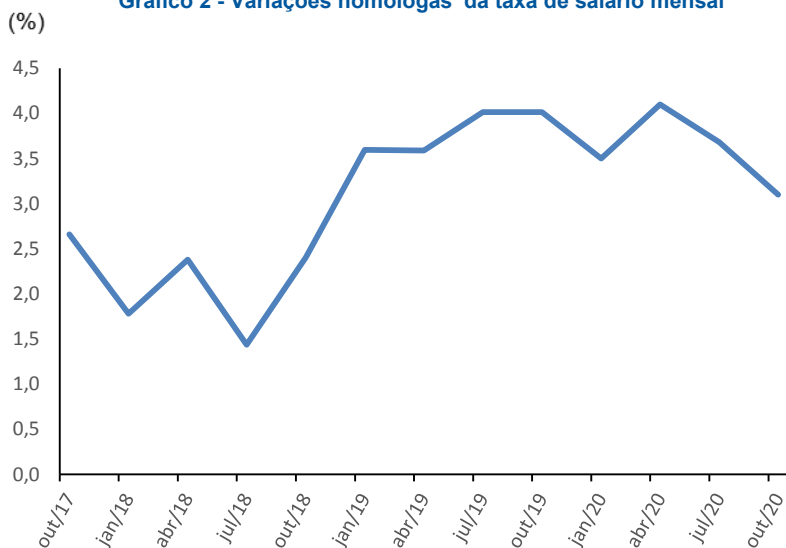
Gráfico 2 - Variações homólogas da taxa de salário mensal

Os crescimentos homólogos mais significativos foram observados nas profissões de Ladrilhador (6,8%), Espalhador de Betuminosos (6,1%) e de Pintor de Construções (5,1%). A variação homóloga mais reduzida, de 0,4%, verificou-se na profissão de Carpinteiro de Limpos e de Tosco (Gráfico 3).