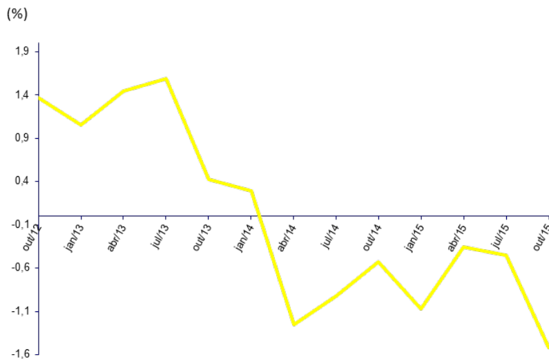
Gráfico 1 - Variações homólogas da taxa de salário mensal

A análise do gráfico 1 revela, desde abril de 2014, variações homólogas negativas da taxa de salário mensal para o conjunto das profissões abrangidas no inquérito em referência.