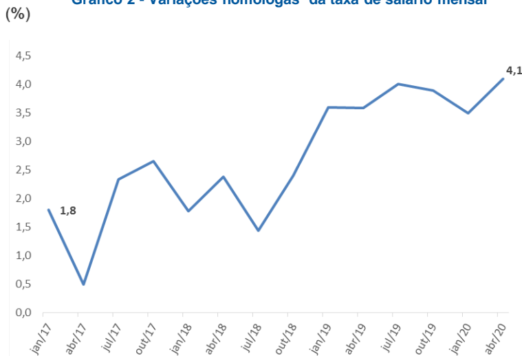
Gráfico 2 - Variações homólogas da taxa de salário mensal

Em todas as profissões a taxa de salário mensal registou variações homólogas positivas. As variações mais elevadas foram observadas nas categorias de Operador de Máquinas de Escavação , Terraplenagem , de Gruas e similares (6,5%), de Motorista de Veículos Pesados de Mercadorias (5,0%) e de Canalizador (5,0%). A variação mais baixa, por sua vez, verificou-se na profissão de Carpinteiro de Limpos e de Tosco (2,4%). (Gráfico 3).